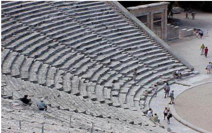
Starożytny grecki teatr w Epidauros - znacie to?

Starożytna Grecja była pierwszym krajem europejskim, w którym przedstawienia dramatyczne wzrosły do poziomu sztuki. W dramacie starogreckim górowało słowo poetyckie, które było recytowane na tle muzyki poetyckiej i tańca.