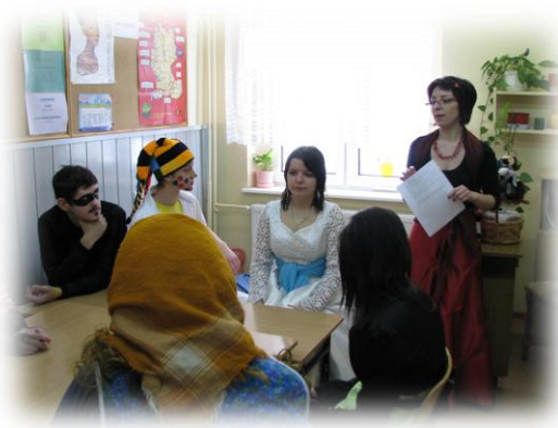
przedstawienia i warsztaty z dziećmi