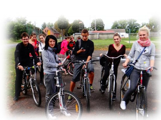
Polsko-niemiecki projekt turystyczny z GPS-em na rowerach